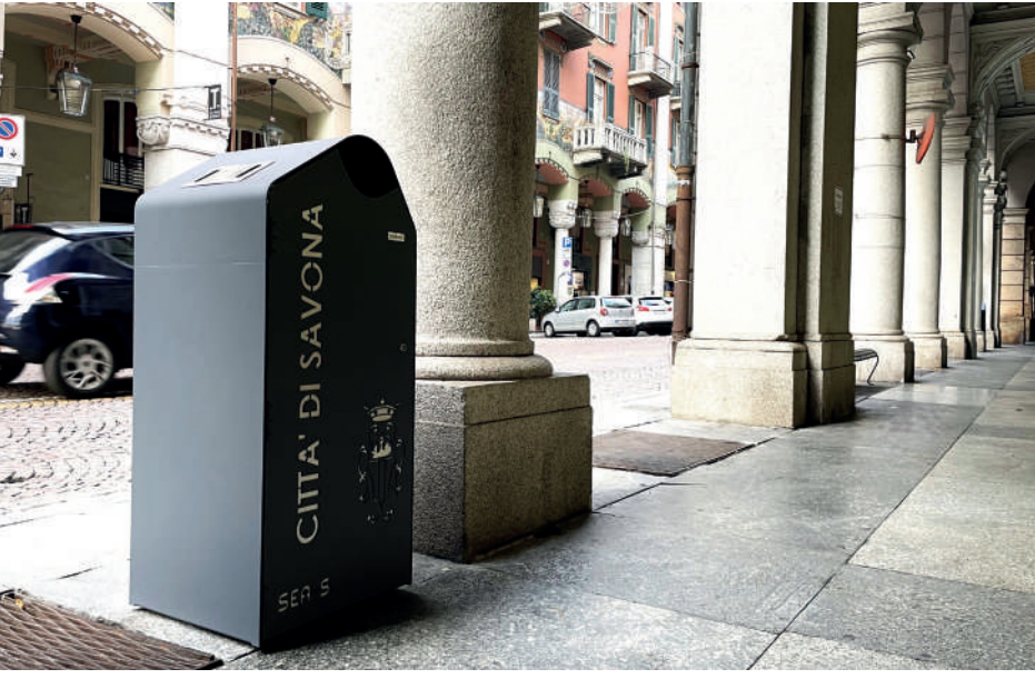
INSTALLAZIONI DEL CESTINO DUNA NEL COMUNE DI SAVONA