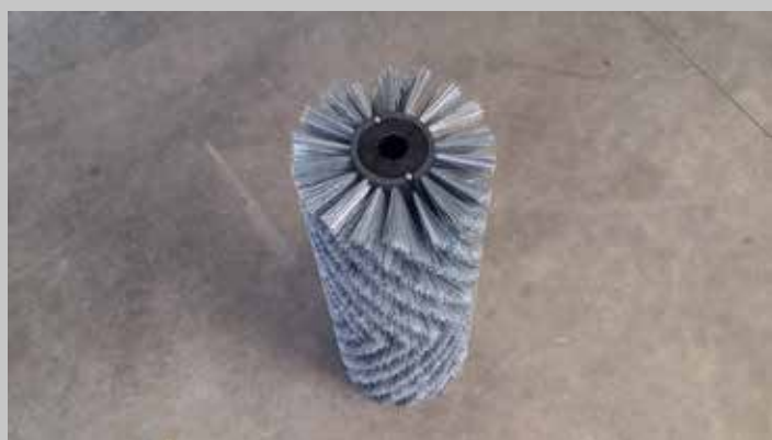
Spazzola in PPL-TYNEX / PPL-TYNEX brush Spazzola in TYNEX / TYNEX brush