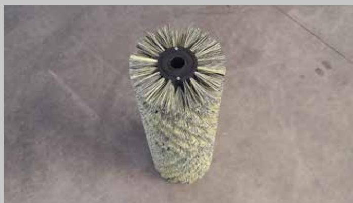
Spazzola in PPL / PPL brush